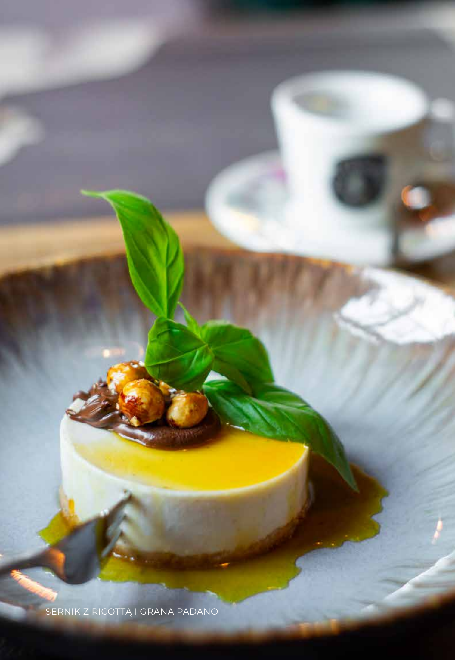
SERNIK Z RICOTTĄ I GRANA PADANO