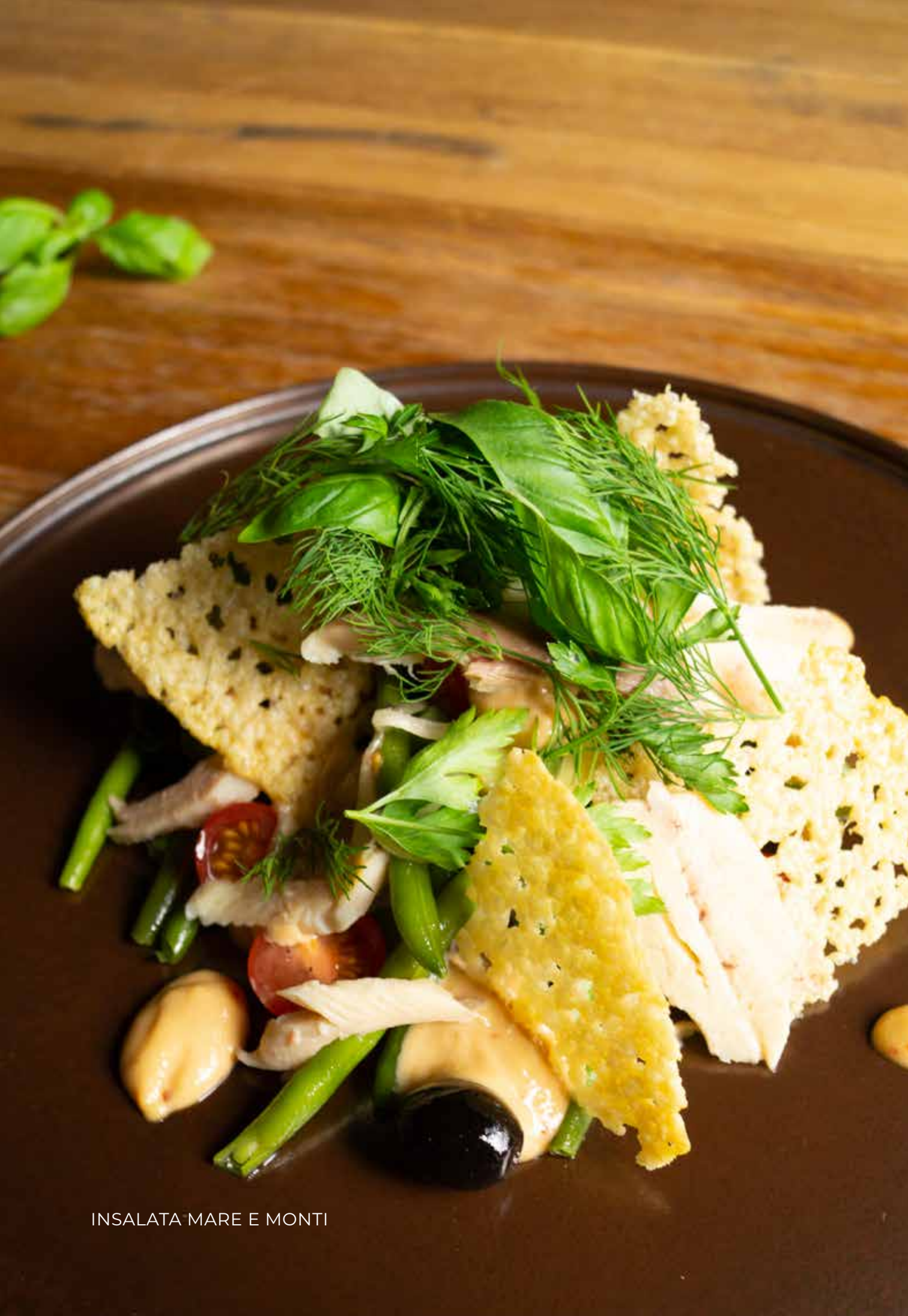
INSALATA MARE E MONTI